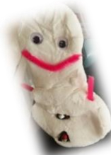
クリスマスクイズ