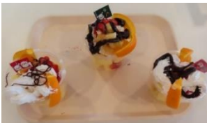
いろんなケーキが完成！