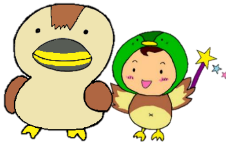
カモン かんもちゃん